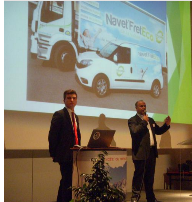
L'entreprise Prabel Transport a présenté sa Navet'Fret éco.