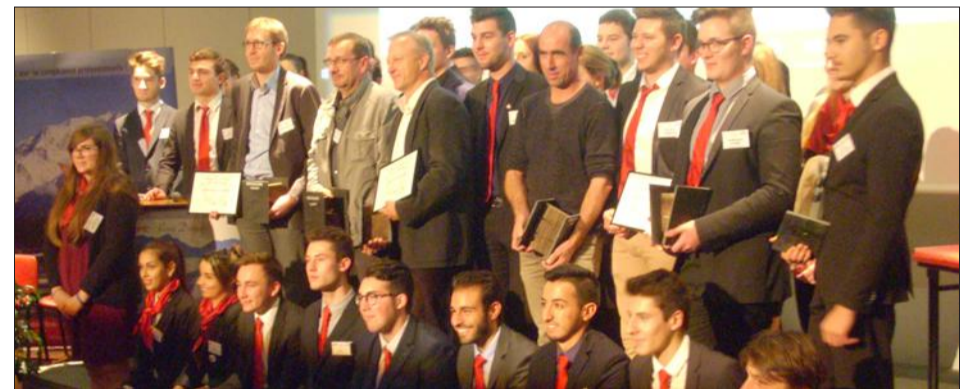
Les lauréats aux côtés des étudiants de BTS.

L'entreprise Mini-Rectification (Scionzier), qui travaille à